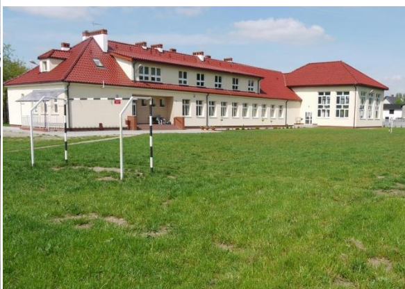
Szkoła Podstawowa im. M. Konopnickiej w Radolinie