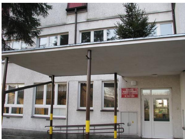
Szkoła Podstawowa im. M. Skłodowskiej-Curie w Przyjmie