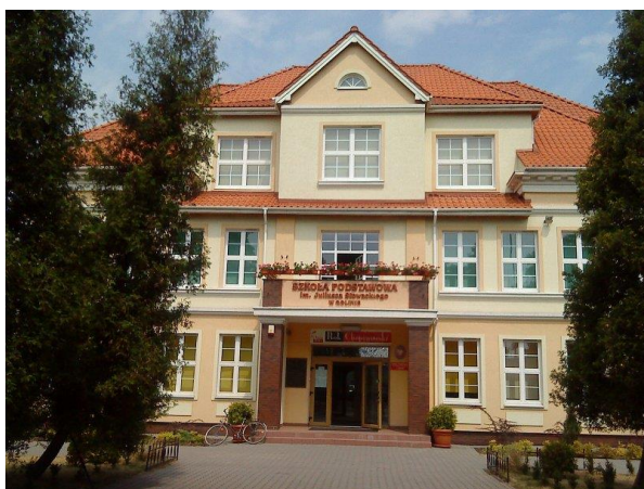
Szkoła Podstawowa im. J. Słowackiego w Golinie