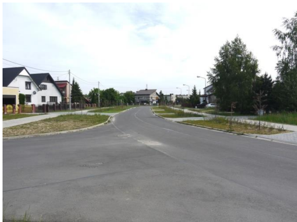
Golina, skrzyżowanie ul. Bohaterów II Wojny Światowej z ul. Armii Poznań