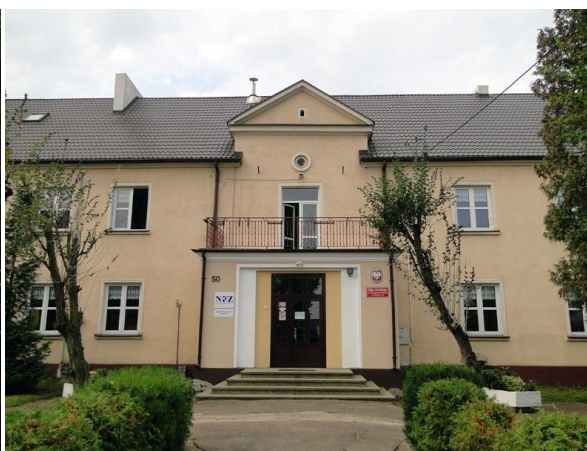
Szkoła Podstawowa im. S. Wyspiańskiego w Kawnicach