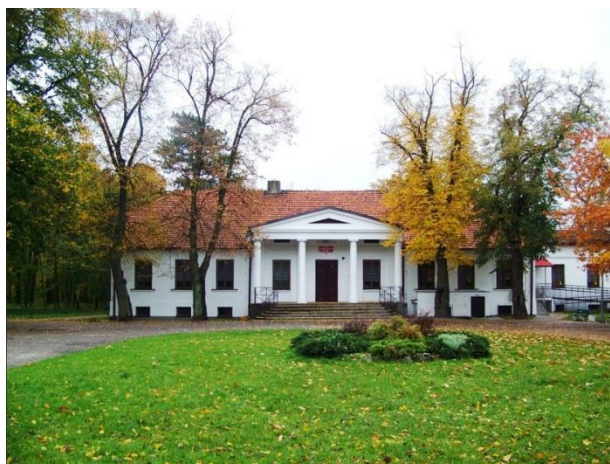
Przedszkole „Baśniowy Dworek” w Golinie

Dodatkowo na terenie gminy Golina funkcjonowało Przedszkole Niepubliczne „Tęczowa Dolina”, w placówce funkcjonował Niepubliczny Żłobek zapewniający opiekę dla około 14 maluchów.