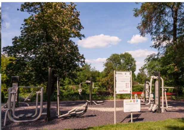
Siłownia zewnętrzna w Parku w miejscowości Radolina (aut. Katarzyna Żabierek)