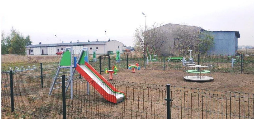
Zagospodarowanie przestrzeni publicznej poprzez budowę miejsc rekreacji w gminie Golina-siłownia i plac zabaw w Kraśnicy