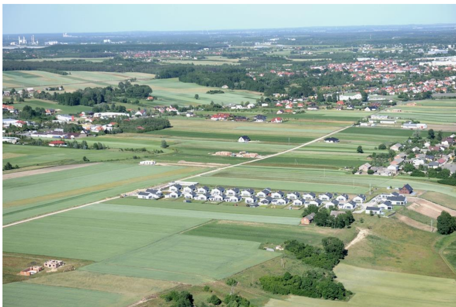
Widok na tereny inwestycyjne i Osiedle Zielona Dolina w Kraśnicy

W 2018 roku wydano 185 decyzji o warunkach zabudowy, w tym: 153 pod zabudowę mieszkaniową, 3 pod zabudowę usługową, 29 pozostałe. Wydano również 16 decyzji inwestycji celu publicznego.